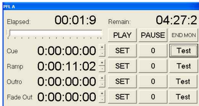
Abbildung 3: Der erweiterte PFL-Modus

Wenn im Konfigurationsprogramm bzw. im Options-Menü so eingestellt, erscheint im PFL-Modus automatisch ein Fenster, über das die zu einem Element gehörigen Zeiten (Cue, Ramp, Outro, Fadeout) festgelegt werden können.